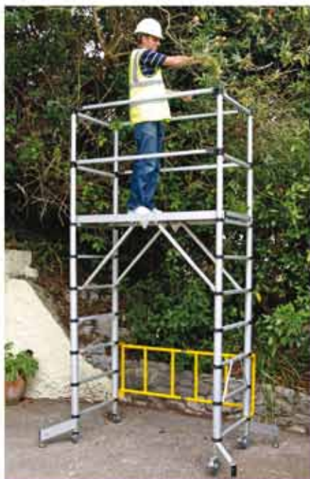
Im Gelände einsetzbar