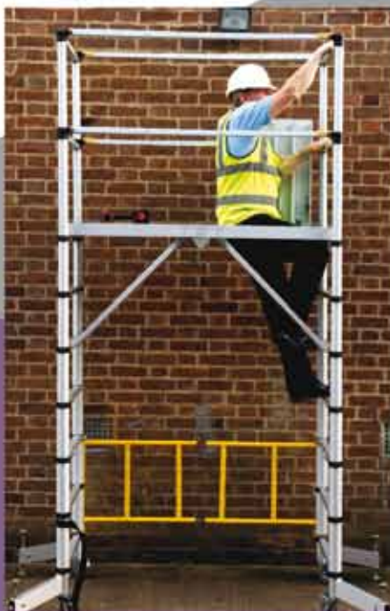
Grosse trittsichere Arbeitsplattform mit Aufstieg durch Luke