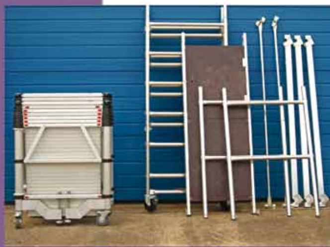
Die Teletower im Vergleich mit einem normalen Gerüst