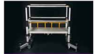
Podium 61 cm