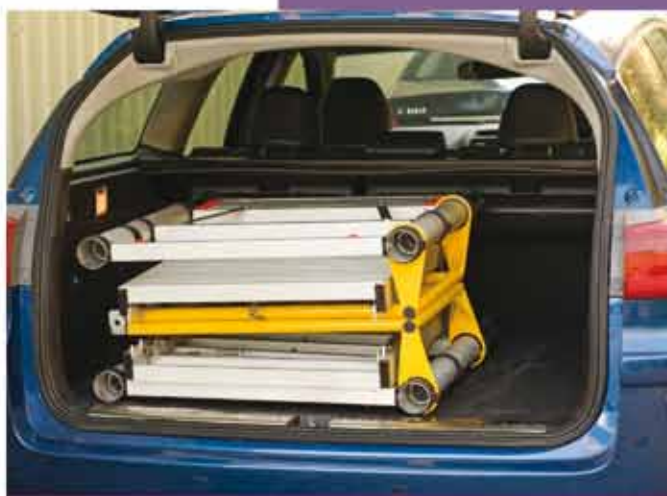
Kann in einem Stationswagen oder kleinem Van transportiert werden