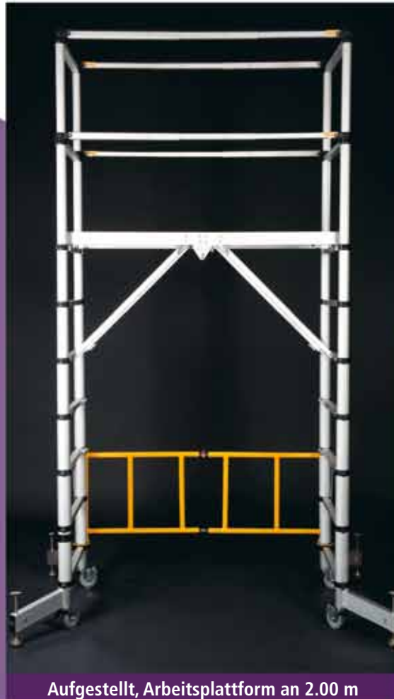
Aufgestellt, Arbeitsplattform an 2.00 m