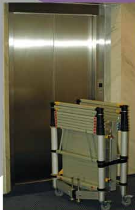
Minimale Grundfläche für einfachen Transport und Lagerung