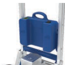
Batterie Lithium amovible