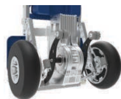
Équipé d'un frein de sécurité