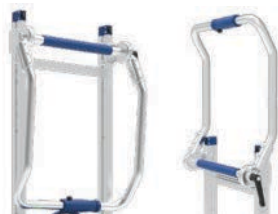
Poignée inclinable, pivotant à 360°