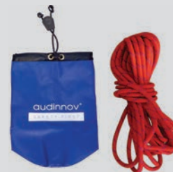
SAC A CORDE SANS COUPELLES