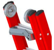
Berceau d'appui en V & roues de façade