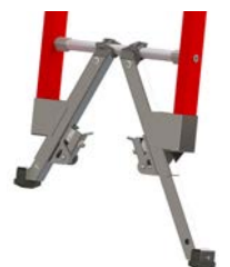
Stabilisateurs en V