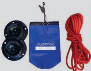
SAC A CORDE AVEC COUPELLES