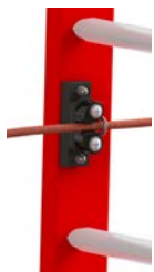
Option : taquets coinçeurs et corde de Ø 10.5