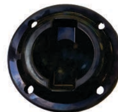
COUPELLES DE REPARTITION