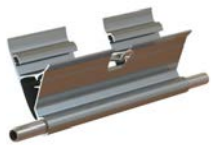
Parachute en aluminium extrudé

CONFORME EN 50-528 | ÉCHELLE TST-BT <1000V A.C/1500 V D.C