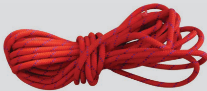
CODE Ø 10.5